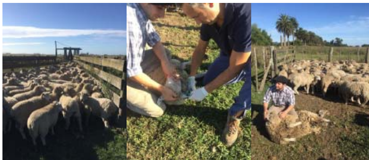
Técnico de Ley Ovina tatuando corderas Texel y cruce Texel x Romney Marsh

El establecimiento “Las Palmeras” posee 265 has, campo mixto típico de la Cuenca del Salado (30% loma, 10% media loma y 60% bajo dulce) apto para la producción ganadera y con algunas parcelas adecuadas para la siembra de cultivos anuales. El mismo se encuentra ubicado en la circunscripción XI, a 1.500 mts de la autovía Juan Manuel Fangio (ex ruta 2) y a 12 km de la ciudad de General Guido, partido del mismo nombre. Aquí la ganadería ovina comparte la superficie con la ganadería bovina. La infraestructura existente se compone de una casa principal, monte, manga, cuatro corrales, galpón, bañadero y luz eléctrica. Los alambrados perimetrales e internos en estado regular pero mantenidos, esperando completar los arreglos que quedan en los perimetrales durante el transcurso del proyecto. El establecimiento se divide en 10 potreros, utilizando alambrado eléctrico para su mejor aprovechamiento. La superficie destinada a la actividad ovina supera las 70 has.